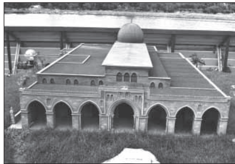
Die Masdschid al-Aqsa in Jerusalem ist die drittichtigste Moschee der Muslime. Von hier aus brach der Prophet zu seiner Himmelsreise auf.