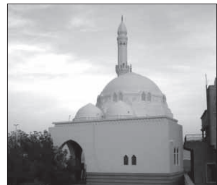
Die Masdschid al-Dschuma ist die Moschee bei Medina, in der das erste Freitagsgebet verrichtet wurde.