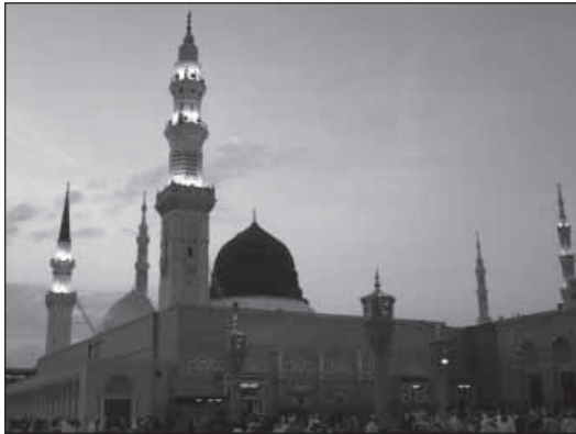
Die Masdschid an-Nabawi ist die Moschee des Propheten in Medina. Hier ist der Prophet Muhammad begraben.