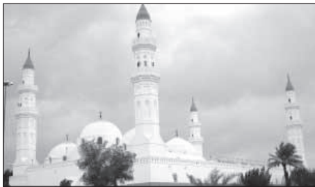
Die Masdschid al-Quba ist die erste Moschee des Islams bei Medina. Bei ihrem Bau half der Prophet Muhammad persönlich mit.